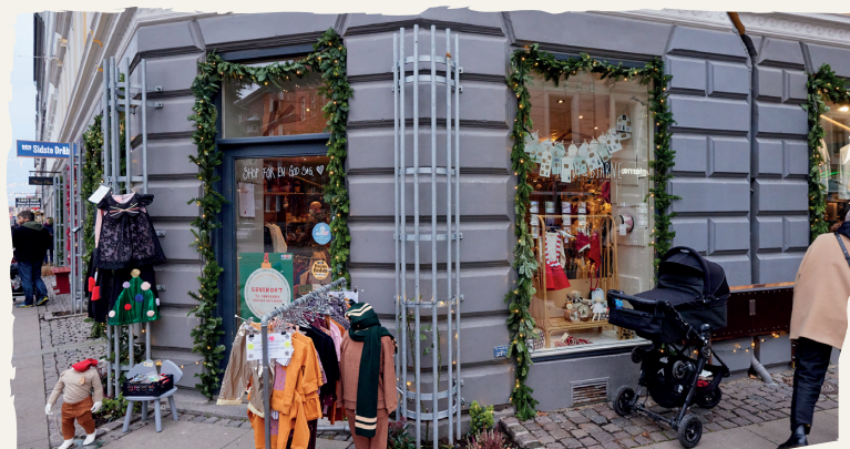
I Saxogades socialøkonomiske butikker har vi mange forskellige opgaver, som vi tilpasser det enkelte forløb. Her er der billeder fra butikkerne Heidi & Bjarne, Normas, Grønne Kræfter, Fredes Wood Shop, Grønne Kræfter, LØS marked og Cafe Sonja.